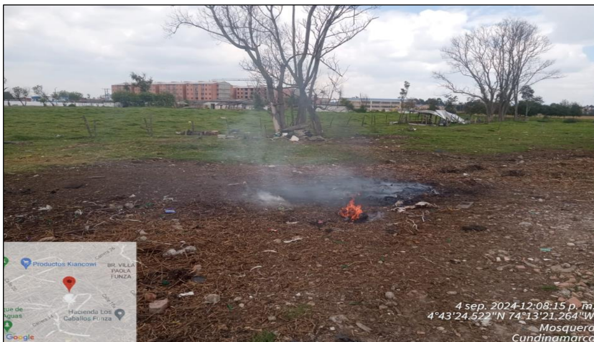
Ilustración 4. Quema a cielo abierto

En este punto se solicita al señor identificar el nombre del predio quien referencia que se denomina Finca San Antonio, posteriormente se realiza traslado al punto donde se registra la quema de residuos el cual se encuentra ubicada en las coordenadas 4°43'24.522" N y 74°13'21.264" W como se observa en la ilustración 4.