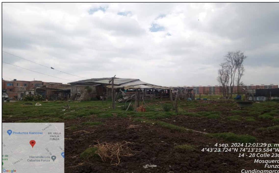
Ilustración 2. Ubicación Finca San Antonio

C.P. 250020 Tel. +57(1) 823 40 70 823 40 71 / 823 40 73 Fax. +57(1) 825 76 20 Dir. Cra. 14 No. 13-05