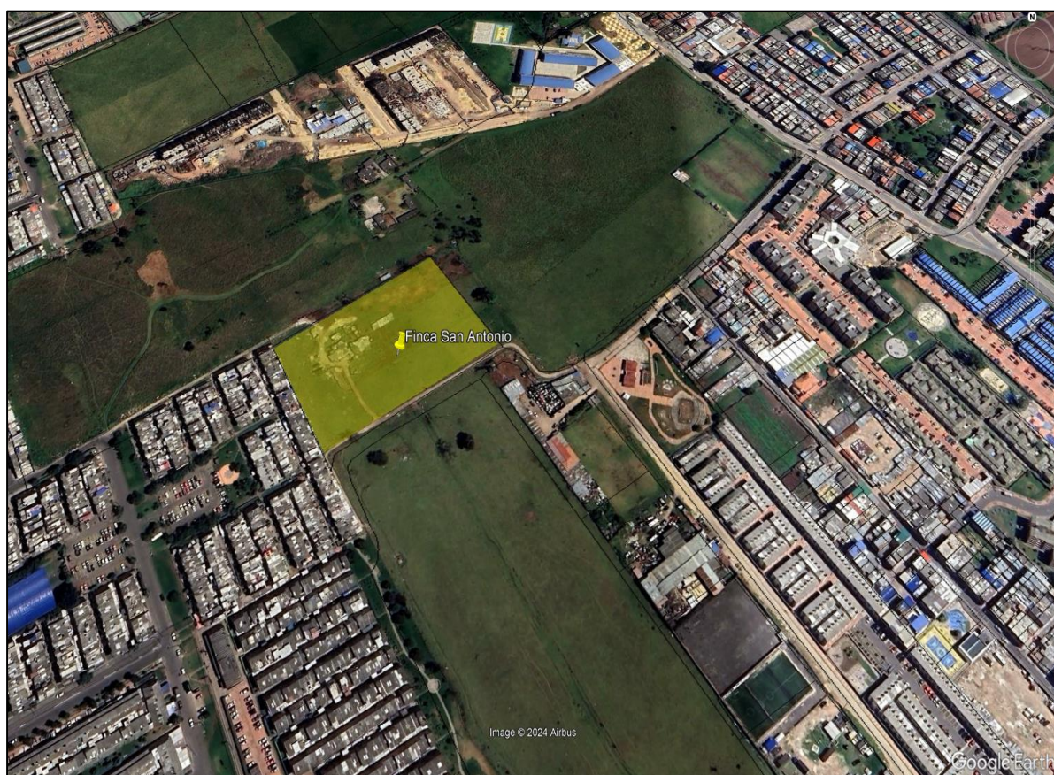
Ilustración 1. Ubicación

Teniendo en cuenta que ante el municipio de Funza se interpuso queja por quema a cielo abierto, el día 4 de septiembre personal adscrito a la Secretaría de Ambiente y Bienestar Animal, realizó inspección de conformidad con el acta de visita ambiental No 153, en el predio ubicado en la vereda Siete Trojes, finca San Antonio (ver ilustración 1. Polígono Amarillo), coordenadas 4°43'23.724" N y 74°13'19.584" W, como se muestra en ilustración 2.